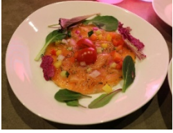
サーモンマリネ オリーブオイル ドレッシング