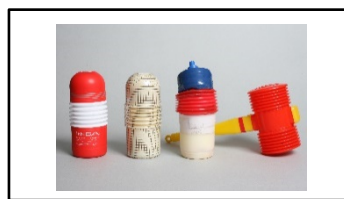
紹介された試作品②：ローリングヘッドカップ ピコピコハンマーの形状を応用して制作