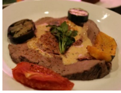
ローストビーフ キャブサイシンソース