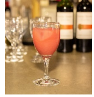
TENGA DEEP THROAT CUP

※料理や栄養素については、月刊TENGA 第7号『下半身に効く!?お料理レシピ』で紹介