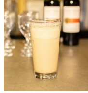
TENGA SWEET LOVE CUP