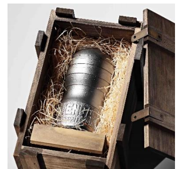
専用のオリジナル木箱に梱包

【本件に関するお問い合わせ】 ● TENGAコーポレートサイト： https://tenga-group.com