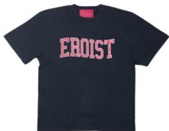
EROIST VINTAGE TEE (Black)

ヴィンテージ加工を施したボディに、「EROIST（工口を追求する者）」と「EROSOPHY（工口の哲学）」のメッセージを変形カレヅ風ロゴであしらいました。古着のような風合いとコンセプトが融合した、工口味溢れるTシャツに仕上がっています。本アイテムは、工口市会場となるTENGA LANDのほか、TENGA STORE TOKYOおよび、ZOZOTOWNでもお買い求めいただけます。