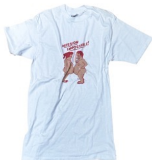
MISSION IMPOSSIBLE WHITE T-SH ¥17,600（税込）

『原宿エロ市』では、「なんかエロい」「ちょっとエロい」「ちゃんとエロい」から、「これ、なんでエロいの？」まで、さまざまな視点でセレクトされた“エロい古着”を販売します。古着に宿る時間や記憶、そして言葉にしきれないニュアンス。どこか惹かれる「なんかエロい」という感覚から目を背けず、自分自身の感性で“エロ”を見つける体験を楽しんでください。「なぜエロいのか分からない」そんな時は、販売スタッフがその魅力を性心誠意ご説明いたします。