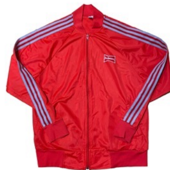
BUD WEISER RED JERSEY ¥ 22,000