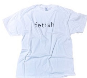
FETISH DS WHITE T-SH ¥9,900