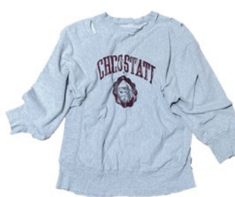
RW DANEGED SWEAT ¥ 14,300