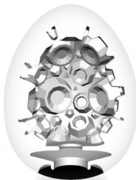
ENTRY No.1 CRATER