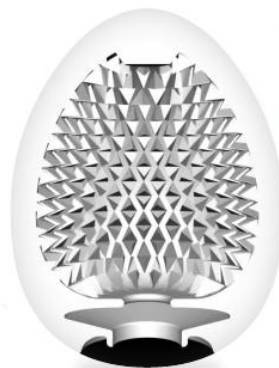
ENTRY No.6 MISTY