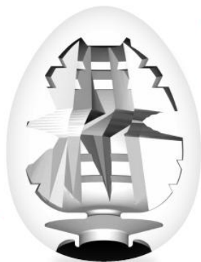
ENTRY No.7 THUNDER