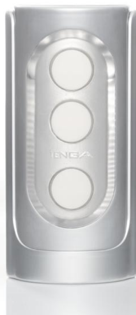
「FLIP HOLE SILVER」