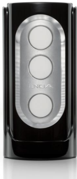
「FLIP HOLE BLACK」