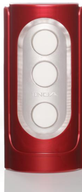
「FLIP HOLE RED」

■ 製品画像は以下よりダウンロード下さい。 http://www.tenga.co.jp/press/fliphole.zip