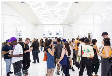
Flagship Storeオープニングパーティの様子

アメリカでは日本と同時のタイミングでコラボレーション製品第二弾を発売。ロサンゼルスでは2018年8月24日に初のFlagship StoreをOPEN。初日は大行列のなか700名のファンが来店し盛り上がりを見せました。前日の8月23日にはファッション、スケート関係のゲスト約150名を招待したパーティを開催し、盛況のうちに終了しました。