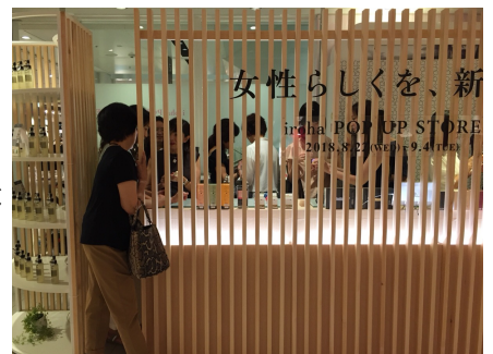
2018年8月に大丸梅田店で実施した irohaポップアップストアの様子