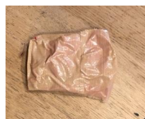
本体は他プラスチックボトルと廃棄※ガムテープは可燃ごみへ