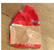
表面パッケージはガムテープで、見えないように巻く