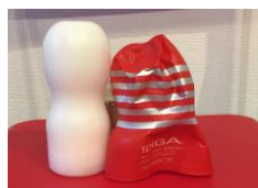
表面パッケージをむく