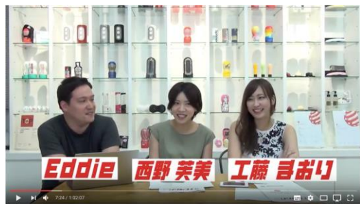
テンガトーク第1回 TENGAS社員に聞いてみたい！