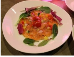
サーモンマリネ オリーブオイル ドレッシング