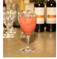
TENGA DEEP THROAT CUP

※料理や栄養素については、月刊TENGA 第7号『下半身に効く!?お料理レシピ』で紹介