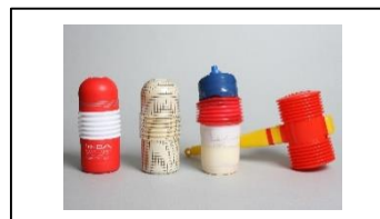
紹介された試作品②：ローリングヘッドカップ ピコピコハンマーの形状を応用して制作