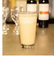
TENGA SWEET LOVE CUP