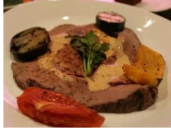
ローストビーフ カブサイシンソース