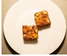
刺激的な 甘酒チョコナッツ